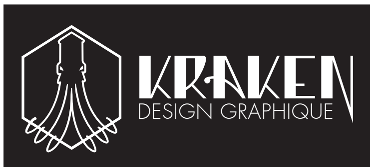
«Kraken» Identité visuelle - Carte de visite - Typographie