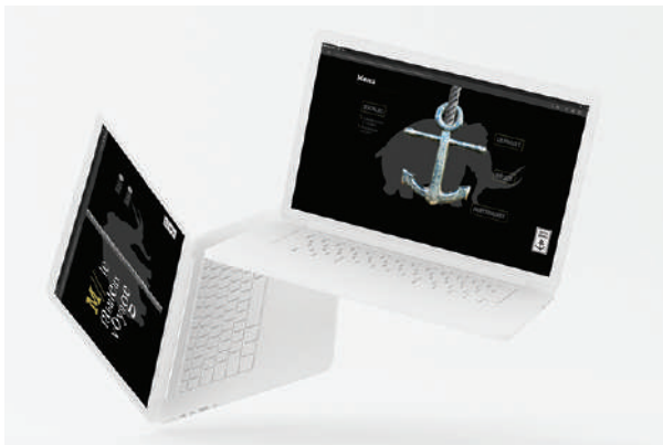
«Le Projet M» Maquettage UX design