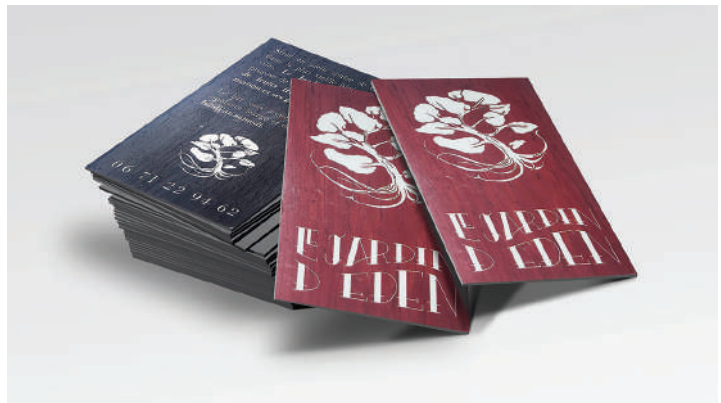
«Le Jardin d'Eden» Identité visuelle - Carte de visite - Typographie